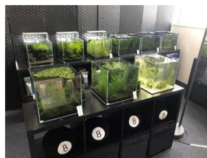
メダカ販売店の店内風景

このような メダカを売ることで、障がい者の工賃を上げることが可能ではないだろうか? という、メダカと福祉をつなげるという着想を得たことがはじまりである。