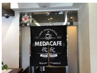
2018年6月にオープンした 2事業所目のメダカフェ

現在は就労継続B型のみだが、今後はメダカ事業を行うことで、 1人でも多くの障がい者や障がい児の方々の幸せに繋がる支援 ができればと思っている。