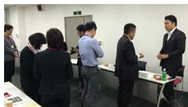
ゲスト講師への 質問の行列