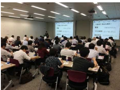
過去のセミナー風景