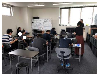
メダカの育成&販売方法について学習している風景