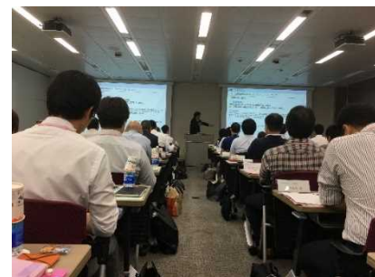
過去のセミナー風景