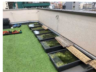
ベランダを活用し メダカやバクテリアを育成中