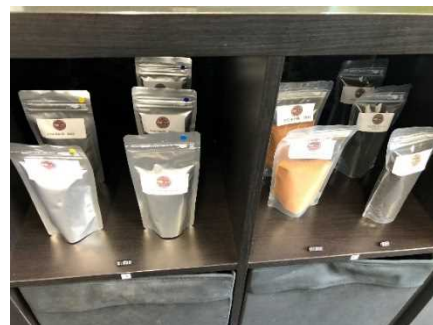
メダカのエサなど 関連商品も販売している

人との関りの中で、自分を表現する力、体調の好調不良の波をどの様にコントロールするか、一般企業就労を進めるには、 「組織の中でうまくやっていた人」という判断を大事 にしている。そのため一般就労へ繋がった方は、 1年経過した現在でも定着 し、元気に働かれている。