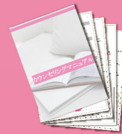
カウンセリング マニュアル