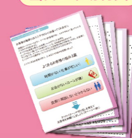
クロージング回答集